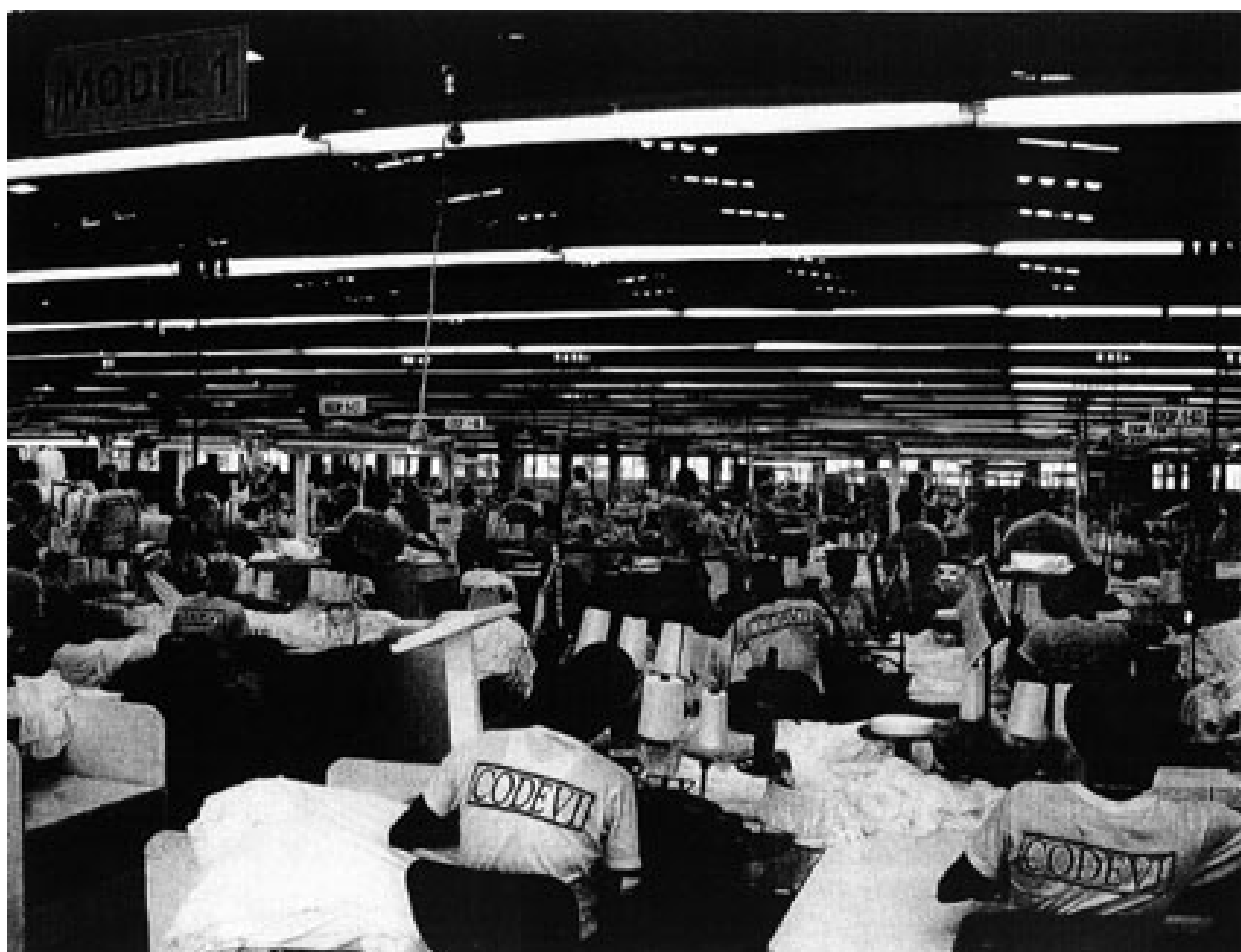
CODEVI est une « zone franche » en Haïti

VIVE LA LUTTE DES MASSES POPULAIRES HAÏTIENNES !