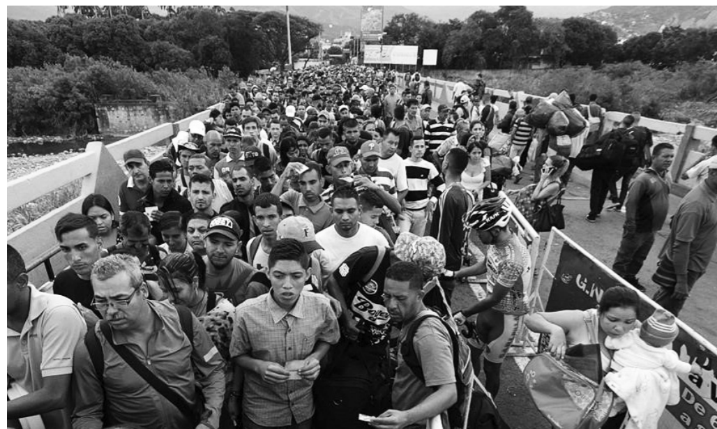
25 juillet 2017 - Les gens font la queue pour traverser le pont international Simón Bolívar, du Venezuela vers la Colombie.

crises économiques et politiques. Il leur incombe également de résoudre les problèmes sociaux et humanitaires causés par les crises.