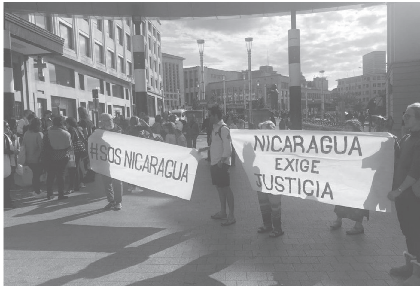
15 septembre - Manifestation à Bruxelles pour la libération des prisonniers politiques au Nicaragua.

catholique, qui pendant des années toléraient le tyran, n'avaient d'autre choix que de commencer à s'y opposer, tout comme le gouvernement étasunien et ses organisations internationales.