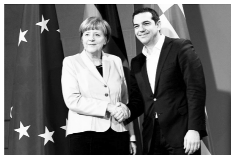
Merkel et Tsipras s'entendent bien.

On peut dire la même chose de Podemos et des nouvelles administrations municipales dans l'Etat espagnol, lesquelles, loin d'exprimer un changement quelconque, finissent par assurer la présence des grandes entreprises de construction et la privatisation des services publics, en conflit avec les grèves des travailleurs du transport public en Catalogne ou avec les justes exigences de remunicipalisation des balayeurs de rue et des jardiniers madrilènes.