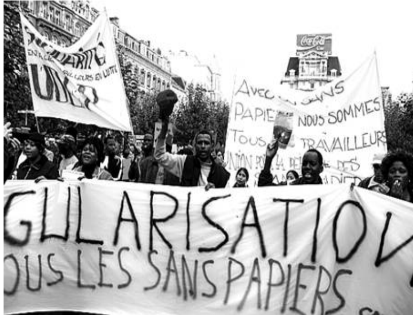
Manifestation lors de la grève générale d'octobre 2005 avec le mot d'ordre :

Jusqu'à présent, toutes les victoires du mouvement ont été obtenues grâce à la lutte, grâce à la construction d'un rapport de force pour faire plier le gouvernement. Et dans cette lutte, il faut que tous les « sans papiers », quelle que soit leur situation, soient unis autour de la revendication de « régularisation de tous les sans papiers ». C'est justement cette unité que le gouvernement redoute. C'est pourquoi il cherche, par tous les moyens et par l'intermédiaire de ses organisations (CIRE, FAM), à diviser les « sans papiers », en essayant de les convaincre qu'il faut être réaliste, que tout le monde ne peut pas être régularisé , et donc qu'il faut des critères clairs et permanents.