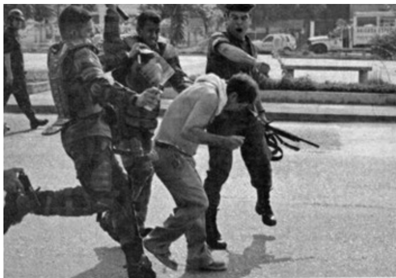
Répression violente contre les travailleurs de Sanitarios Maracay sur l'autoroute Caracas- Maracay, le 24/04/2007

Ses discours et le texte du projet de la nouvelle constitution peuvent être pleins de références au « socialisme ». Mais une fois dégagée l'emballage rhétorique, sa politique réelle n'a rien à voir avec les intérêts et les nécessités des travailleurs, mais beaucoup avec ceux des bourgeois comme Álvaro Pocaterra.